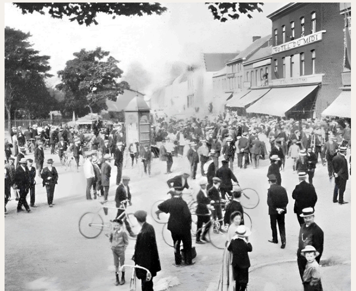
Vue d'Erquelinnes, sympathique petite cité hennuyère frontalière de la France où la fanfare communale se multiplie pour accompagner les rescapés au départ de la 4 e étape

Véritable force de la nature, le Liégeois remporte ainsi l'unique succès de prestige d'une carrière qui l'a pourtant vu batailler avec les meilleurs durant 10 années, malgré la coupure imposée par le conflit mondial.