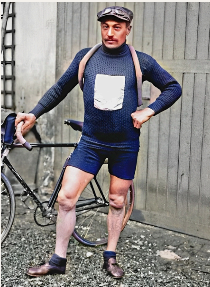
Le très attendu retour de Cyrille Van Hauwaert sur l'épreuve avait enflammé les passions dans toute la Belgique. Mais l'espoir a tourné court. Affaibli, le « Lion des Flandres » ne retrouvera jamais ses sensations. Son retrait lors de la 3 e étape marque la fin d'une ère : celui-ci ne reprendra plus jamais le départ d'une course qui lui aura toujours échappé