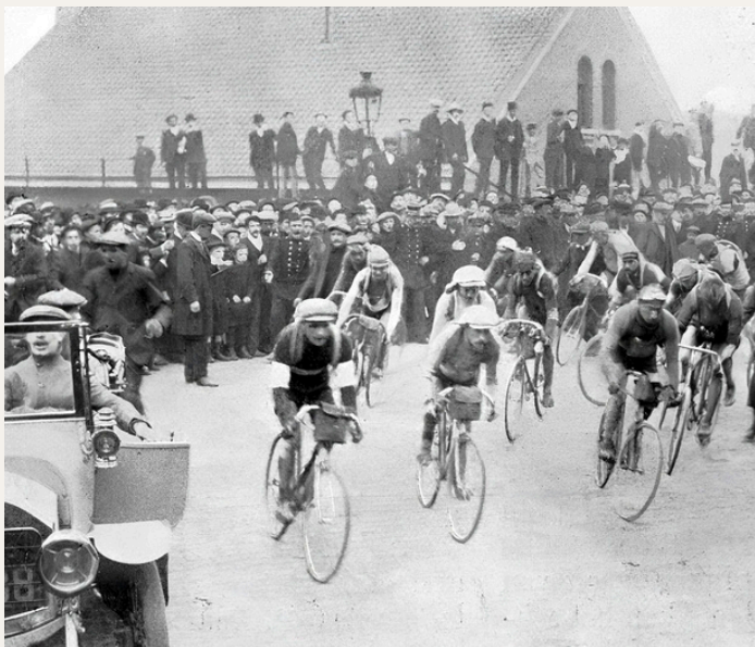
Les coureurs sortent de la zone de contrôle de Tournai sous les acclamations enthousiastes d'une foule nombreuse