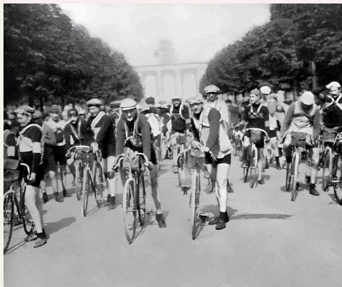
Les 70 partants s'apprêtent à s'élancer de Bruxelles pour un périple de 1752 kilomètres, promettant un suspense haletant tant la concurrence est relevée

La journée initiale est tout d'abord marquée par l'offensive du modeste Roularrien Robert Lamon qui, peu après avoir démarré en traversant la cité militaire de Bourg-Léopold, saute au dessus d'un... pont ouvert pour atterrir sur une péniche en marche et rejoindre l'autre rive sans mal !