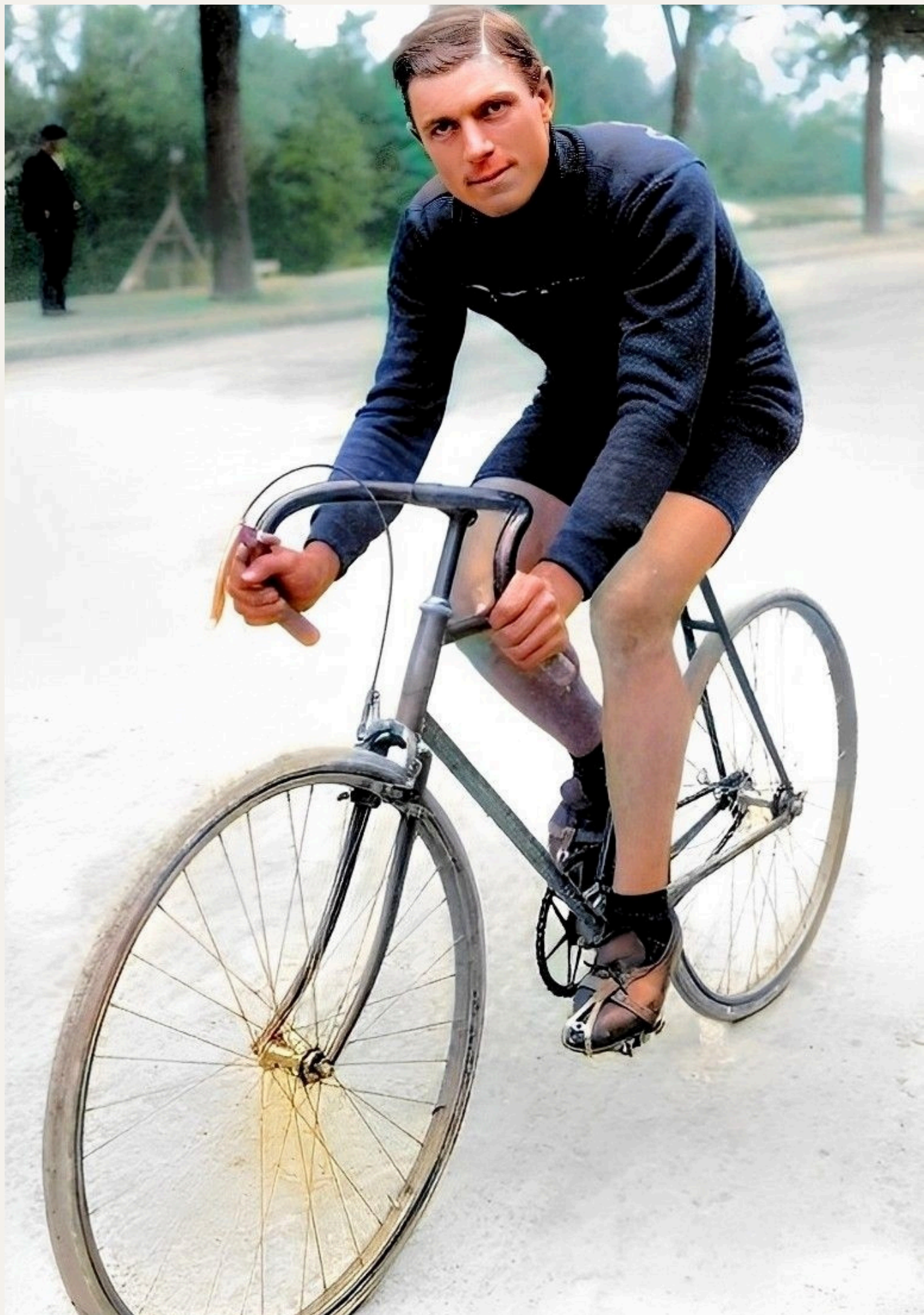
Louis Mottiat restera le dernier vainqueur du Tour de Belgique avant la Grande Guerre. Après quatre années de privation et un retour hésitant en 1919, le champion hennuyer accomplira un exploit plus remarquable encore : revenir au sommet, plus fort qu'il ne l'avait jamais été