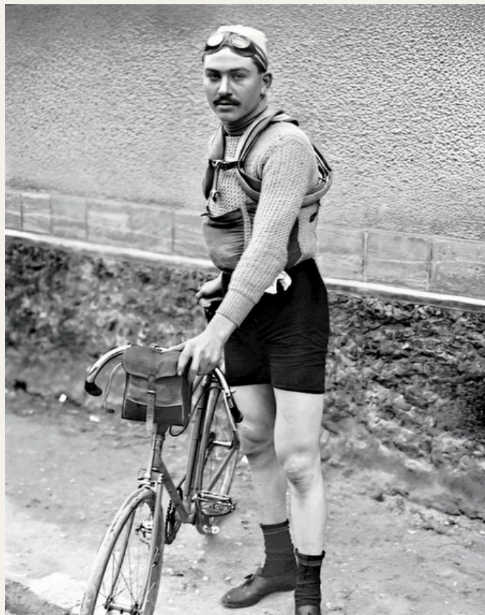
Agé de seulement 22 ans et aux prémices d'une belle carrière, Hector Heusghem signe un véritable coup d'éclat en dominant au sprint les redoutables « Alcyonistes » à Namur. Un crime de lèse-majesté qui prive l'armada bleue ciel d'un monopole complet sur cette édition (Photo Bibliothèque nationale de France)

Troisième au classement final après avoir collectionné les accessits, Paul Deman se montrera plus incisif à Bordeaux-Paris qu'il remportera brillamment. Le Flandrien deviendra ensuite un héros de la résistance en faisant passer des messages codés dans sa dent en or. Arrêté par les Allemands, il ne devra la vie qu'à la signature de l'armistice (Photo Bibliothèque nationale de France)