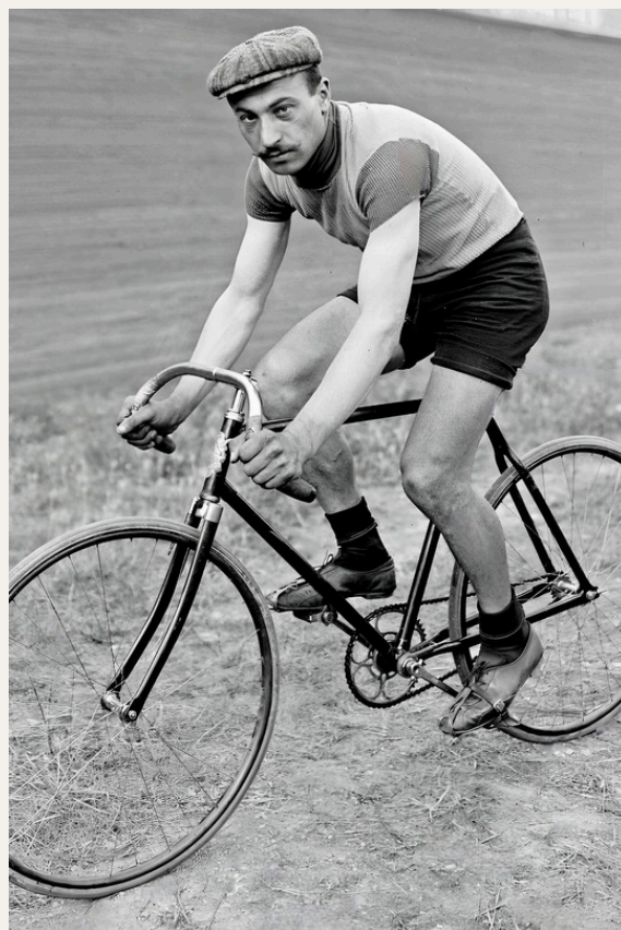
Poursuivi par la guigne, le légendaire Cyrille Van Hauwaert parvient toutefois à répondre aux attentes et à s'imposer à deux reprises avant de devoir laisser le champ libre à ses équipiers français

Ce premier succès de prestige restera l'unique du Normand en dehors de l' Hexagone . Celui-ci va en effet bâtir sa réputation sur les routes du Tour de France. Deux mois après ce retentissant exploit en territoire belge, « la Pomme » y remportera d'ailleurs le premier de ses 5 succès partiels et se classera 4 e au classement final. Deux ans plus tard, le coureur de Seine-et-Loire aurait même dû logiquement y connaître le sacre de sa vie si un empoisonnement ne l'avait fait s'écrouler dans l'Aubisque.