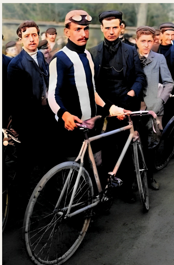
Tout juste auréolé d'un deuxième titre de champion de France (en autant d'éditions), le Languedocien Gustave Garrigou est le seul à réussir à faire vaciller Lucien Petit-Breton

Mais les grands champions sont ainsi faits qu'ils trouvent, dans l'adversité et la souffrance, la force nécessaire pour renaître de leurs cendres. Celui qu'on surnomme « l'Argentin », en raison de son enfance passée à Buenos Aires, de son teint basané, et de sa chevelure de jais, le démontre dès le lendemain.