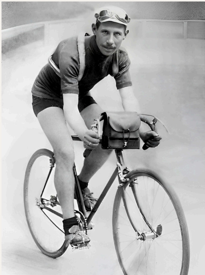
La victoire de Marcel Buysse marque un tournant dans sa carrière. Jusqu'alors discret, malgré une 4 e place au Tour de France l'année précédente, le Flandrien s'affirme pleinement en 1913. Cette saison le verra briller sur la Grande Boucle avec six victoires d'étape et une 3 e place finale, avant de conclure en beauté en remportant le Tour de Lombardie