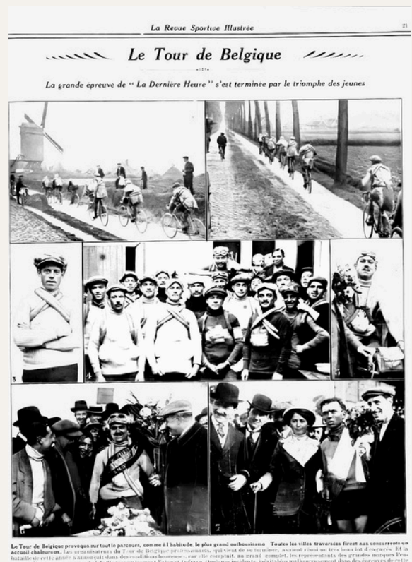
Quelques clichés de cette édition avec en point d'orgue, un document assez exceptionnel : la photo des 17 rescapés au départ de la dernière manche à Anvers