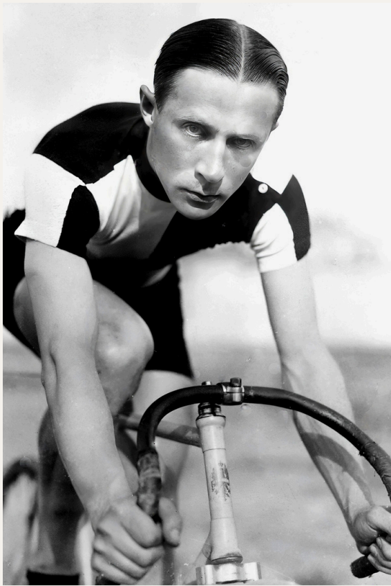
Triple recordman de l'heure entre 1912 et 1914, Oscar Egg a suscité de grandes attentes à chacune de ses 2 apparitions sur les routes du Tour de Belgique. Pourtant, la réalité fut bien terne. Non partant lors de la 5 e étape l'année précédente, le Suisse déçoit à nouveau en renonçant dès la 4 e journée de course. Notons que son dernier record établi à 44,247 kilomètres à l'heure résistera aux assauts du temps jusqu'en 1933