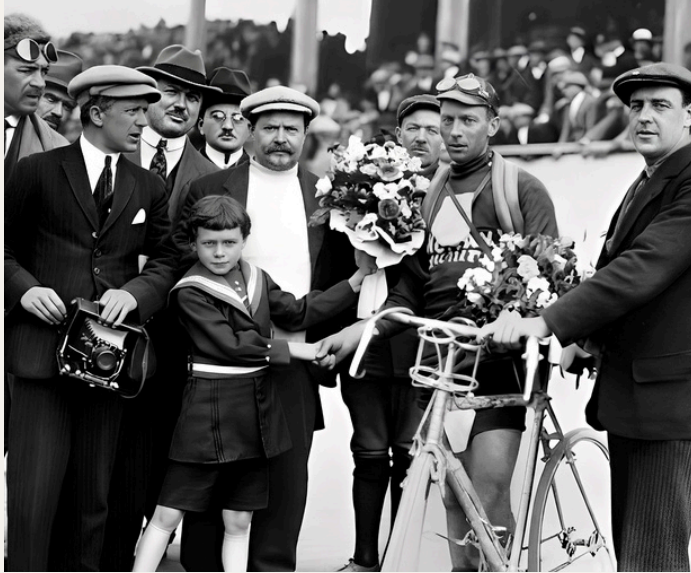
Sur le vélodrome de Luxembourg-ville, Nicolas Frantz ne se classe que 8 e devant son public. Mais le futur double vainqueur du Tour de France n'en est qu'à ses premiers tours de roues chez les professionnels et il oubliera rapidement cette déconvenue en accrochant le podium final

La journée de repos à Luxembourg-ville permet aux rescapés d'assister aux grandes fêtes religieuses données à l'occasion de l'Octave de Notre-Dame dédié à la Vierge Marie. Un dérivatif qui ne les rend manifestement pas plus offensifs puisque la 4 e étape menant les rescapés à Namur est elle aussi escamotée.