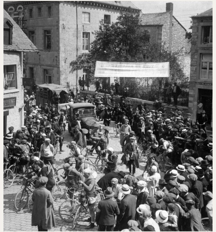
Les 20 derniers rescapés s'apprêtent à prendre le départ de la 4e manche

Désireux de communier avec le nouveau champion, le public envahit la route après son passage, provoquant des chutes et faussant la suite du classement. Les officiels se voient même obligés de transporter le contrôle d'arrivée à l'entrée du stade pour accueillir les lâchés !