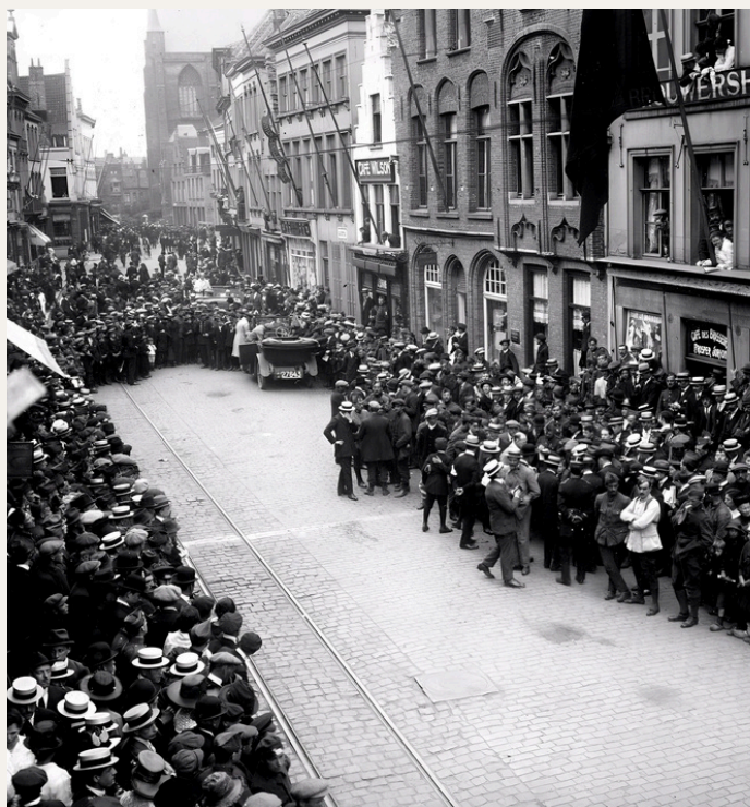
Une foule nombreuse attend l'arrivée des champions à Gand