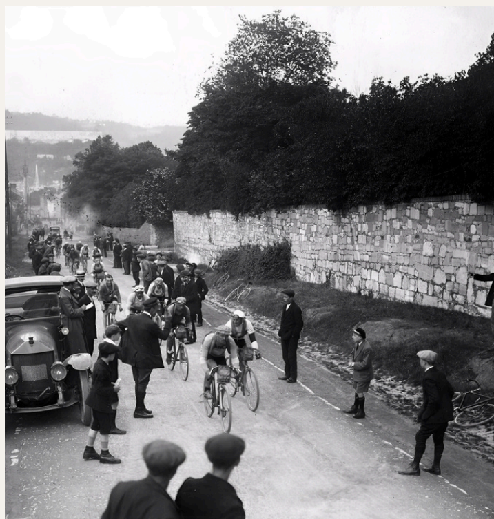
Lauréat de la Grande Boucle six ans plus tard, Lucien Buysse a également appris ses gammes sur les routes du Tour de Belgique. On le reconnaît ici emmenant le peloton dans la côte de la Sarthe, à Huy, lors de la 3 e étape

La majorité du peloton s'en est d'ailleurs rendu compte puisqu'ils ne sont déjà plus que 28 en course, sur 84 partants ! Il faut dire qu'en ce lendemain de conflit, la qualité du matériel est plus que médiocre et les incidents mécaniques contraignent nombre de concurrents à renoncer, tels Odiel Defraye, Firmin Lambot ou Léon Scieur.