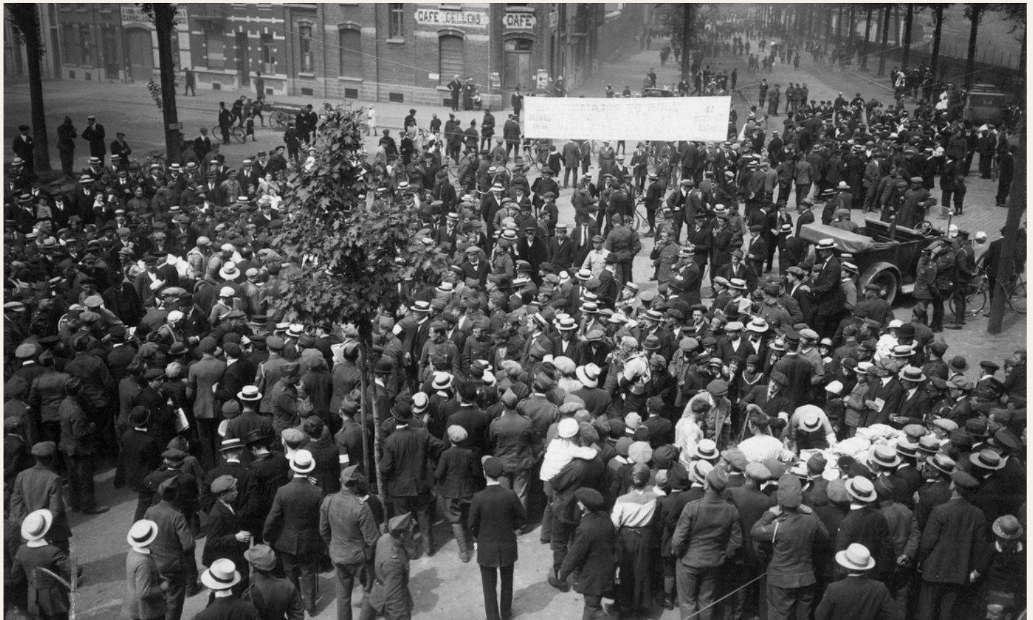
Au départ de l'ultime manche à Namur, les coureurs sont littéralement submergés par un public nombreux venu leur rendre hommage