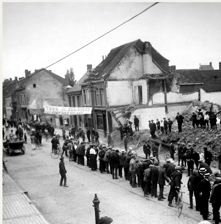
Pris lors de la seconde manche, ce cliché témoigne encore des cicatrices laissées par la Première Guerre mondiale